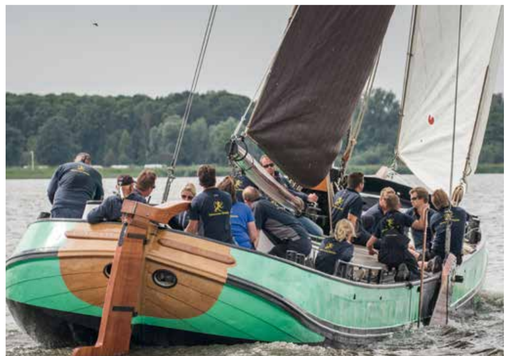
In rustiger vaarwater, tijd voor een babbel.