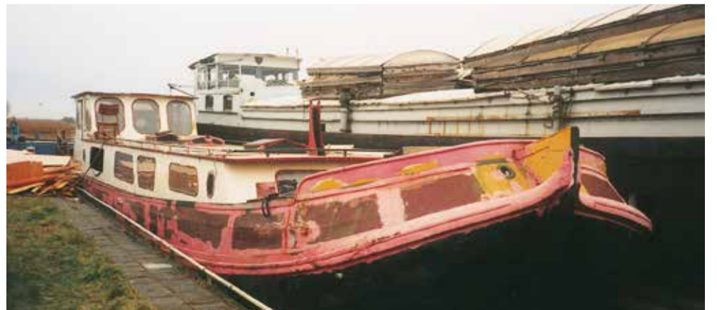
Zo zag de latere Rienk Ulbesz eruit, toen het tot woonboot verbouwde schip van Amsterdam naar Friesland werd gebracht.

Zwaga schafte eens elf 'beagen' - tuig waarin vroeger de schipper of zijn vrouw hingen om het skûtsje door nauwe vaarten